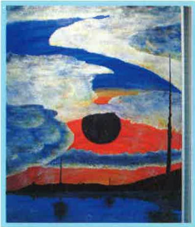
「シキ」油彩F100 大学4年 迫 彩子